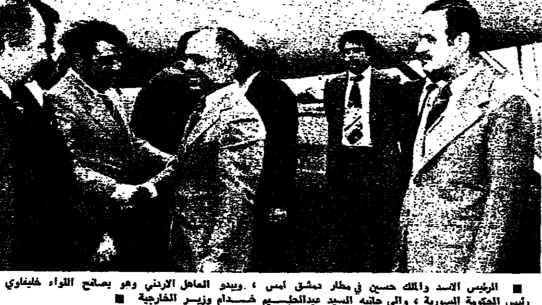
الرئيس الاسد وملك حسين في مطار دمشق أمس، ويبدو المعامل الاردني وهو يصالح اللواء خليفاتي رئيس الحكومة السورية، وإلى جانبه السيد عبداللطيف شحادة وزير الخارجية

بنك التنمية الاسلامي يساهم في مشروع اردني وافق بنك التنمية الاسلامي بنسخ من عدة مقار على تل... بنك التنمية الاسلامي يساهم في مشروع اردني